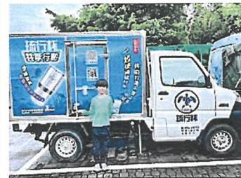
附表一:小琉球 Go Green